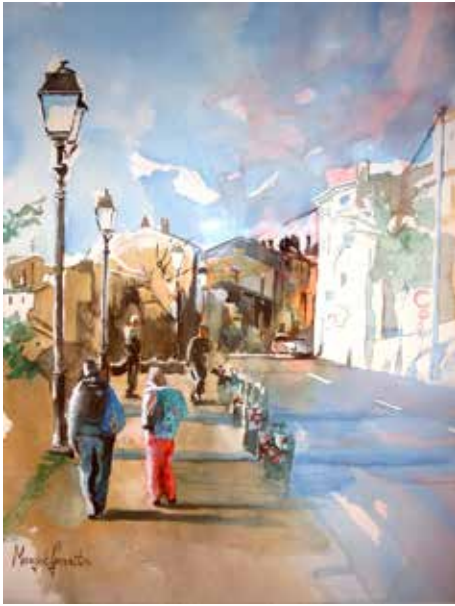
Entrée est du village

En couverture une aquarelle de Margot Gerrits, peintre née aux Pays-Bas en 1961, sortie en 1988 de l'école des Beaux-Arts de Maastricht, tourrettane depuis 1998 et adhérente du "Groupe des 15" créé par Maurice Négrié.