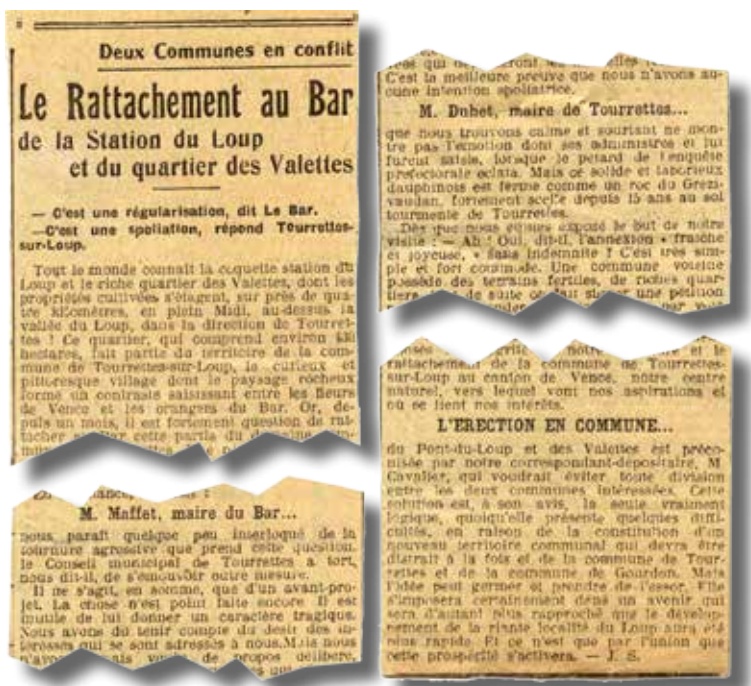
Extraits Petit Niçois : - du 20 novembre 1920 et du 27 novembre 1927

Le point de départ de ce litige est une revendication latente qui se cristallise après la 1 o guerre et se formalise le 20 mars 1920 par une requête signée par des propriétaires et des habitants de ces quartiers, adressée à Monsieur le Préfet pour lui demander de lancer une enquête en vue d'obtenir leur rattachement à la commune du Bar-sur-Loup.