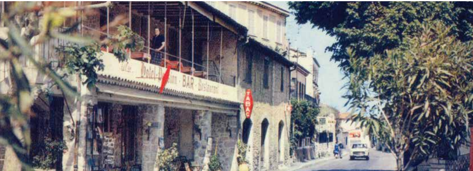
La façade du « café Cresp » quelques années plus tard. le tabac est intégré. À l'étage, Madame Cresp dont la cuisine était très appréciée.