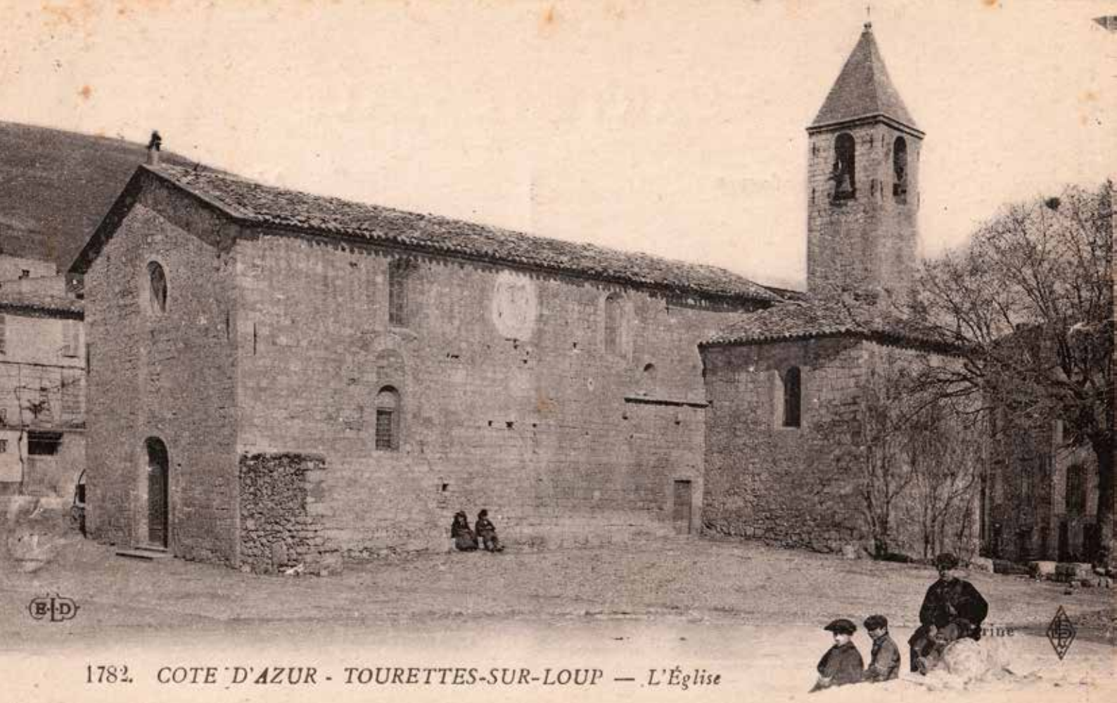
1782. COTE D'AZUR - TOURETTES-SUR-LOUP — L'Église

Carte éditée entre 1905 (transfert du cimetière, on distingue une charrette à gauche) et l'édification du Monument aux Morts inauguré tardivement en 1929. À noter sur la façade sud une petite porte en bois dans l'espace de la porte d'origine de l'église avant la construction de la chapelle du transept. Elle fut supprimée quelques années plus tard. Dans le projet de restauration de l'église en cours la réouverture de cette entrée dans sa totalité est planifiée.