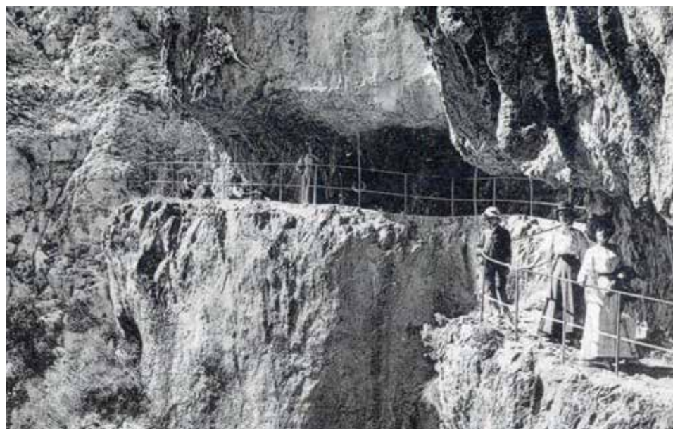
Cet escalier en bois a été doublé par une galerie taillée dans la falaise

Plus loin, le chemin conduisait à la cascade de Courmes, joli filet d'eau tombant du rebord rocheux d'une curieuse excavation semi-circulaire, avant d'être recueillie dans une vasque naturelle. Quelques marches de pierres permettaient d'atteindre un étroit passage creusé à mi-hauteur, qui faisait le tour de la paroi circulaire. Sous la chute, une buvette avait été bâtie sur une petite plateforme. Les randonneurs assoiffés pouvaient prendre leur anisette en tendant le bras sous la cascade pour allonger d'eau leur « pastis ». La promenade pouvait se continuer par-delà le pont de l'abîme, jusqu'au Saut du Loup, impressionnant au temps des grandes eaux et ses cascades pétrifiantes.