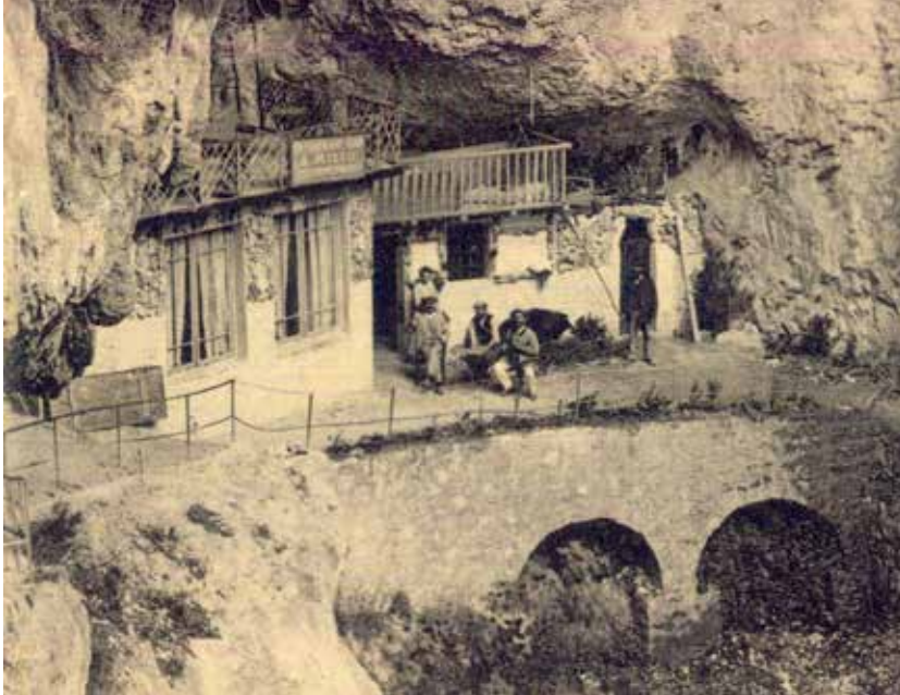
Restaurant Bar A.Millo