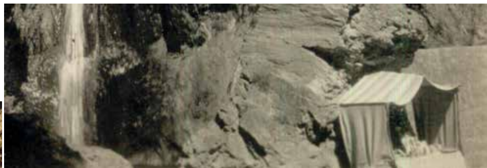
Entre octobre et mars une vendeuse de violettes s'installait au pied de la Cascade Au pieds de l'escalier, les touristes attendent le guide